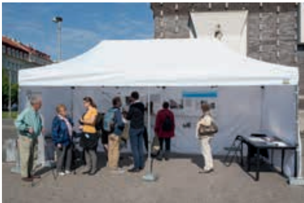
[ OBR 1 ] ... KONZULTAČNÍ STÁNEK UMÍSTĚNÝ NA FREKVENTOVANÉM MÍSTĚ.