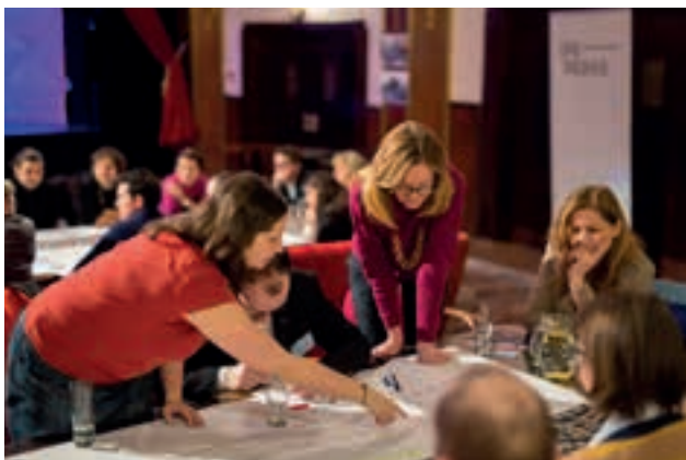
[ OBR 1 ] ... ÚČASTNÍCI POPISUJÍ PROBLÉMY V ŘEŠENÉM ÚZEMÍ.