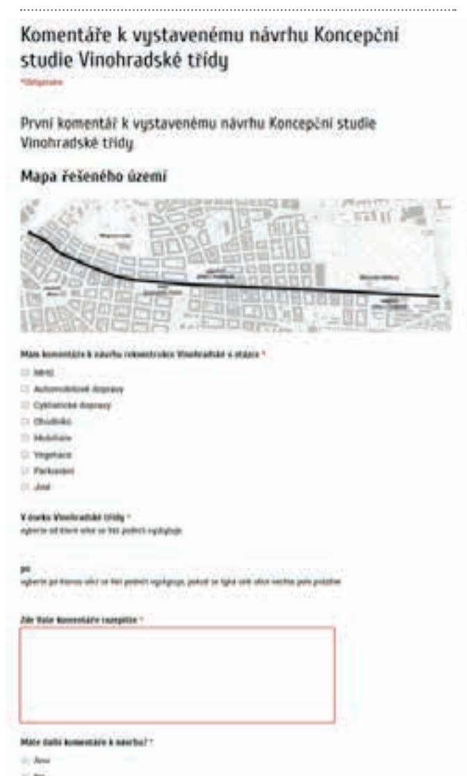
[ OBR 4 ] ... ELEKTRONICKÝ FORMULÁŘ K PODÁNÍ KOMENTÁŘŮ K NÁVRHU.