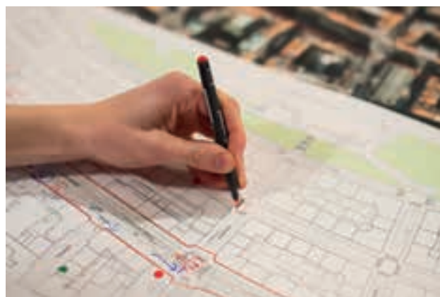
[ OBR 2 ] ... POMOCÍ SAMOLEPÍCÍCH PUNTÍKŮ ÚČASTNÍCI ZAZNAMENAJÍ MEZI JAKÝ TYP UŽIVATELŮ PATŘÍ.

Zaslat výstupy účastníkům setkání. Uchovat mailing list účastníků pro komunikaci v další fázi zapojení občanů.