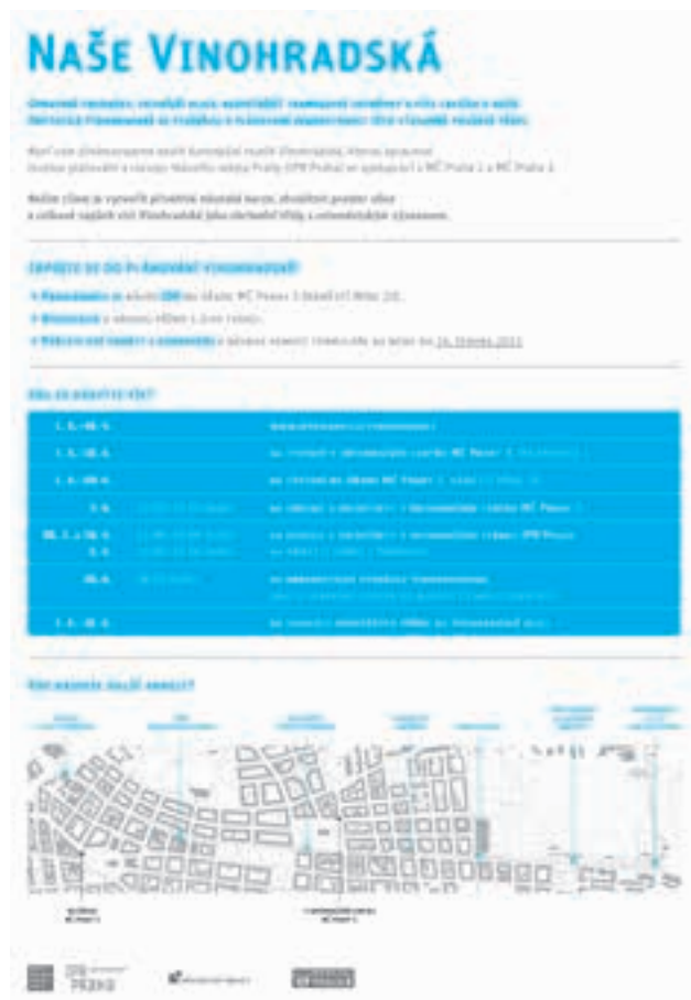
[ OBR 3 ] ... PLAKÁT INFORMUJÍCÍ O TERMÍNECH A UMÍSTĚNÍ STÁNKU.

Informovat občany o průběhu projektu v jeho dalších etapách.