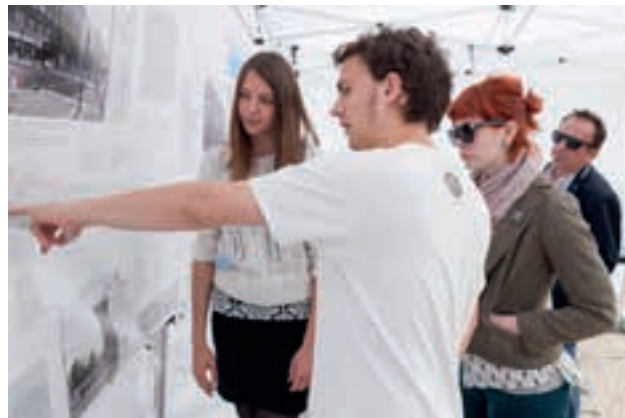
[ OBR 2 ] ... TVŮRCI NÁVRHU ODPOVÍDAJÍ NA DOTAZY NÁVŠTĚVNÍKŮ.