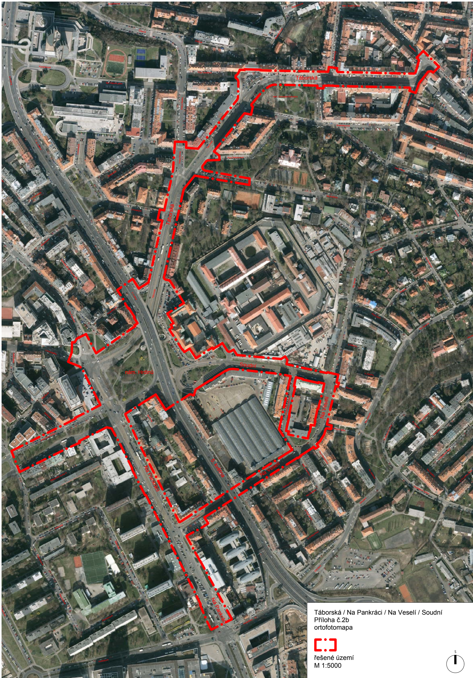
Táborská / Na Pankráci / Na Veselí / Soudní Příloha č.2b ortofotomapa